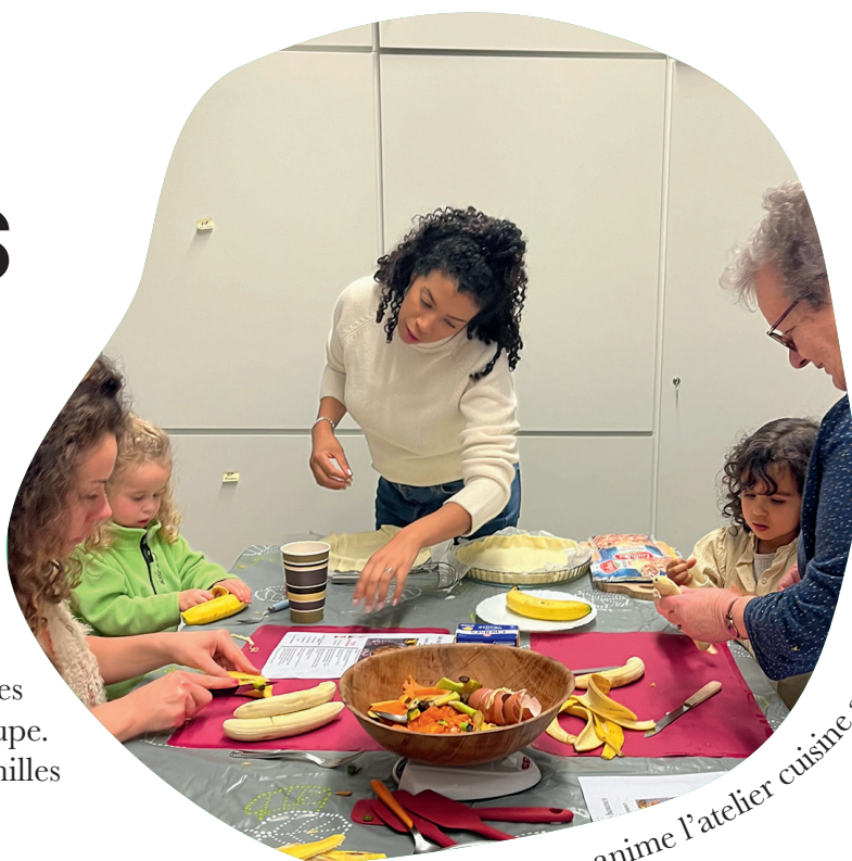
2024 : Une maman co-anime l'atelier cuisine antigaspi

Le secteur familles, ouvert à toutes les familles 1 , vise à renforcer les liens familiaux en créant des espaces de rencontres propices à l'échange, à la communication positive, au partage d'expériences et à la consolidation des relations au sein d'un groupe. L'autonomie et la participation active des familles y sont fortement impulsées. ■